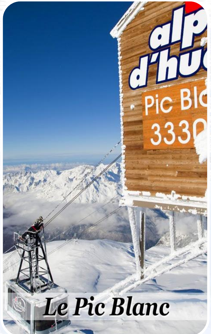
Le Pic Blanc